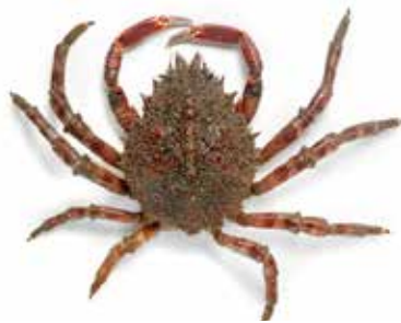
Araignée de mer